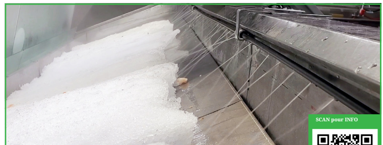
Élimination de la Glace Avec Facilité