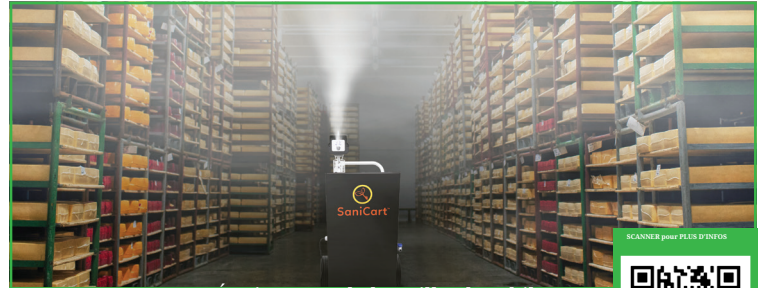
Équipement de brouillard mobile