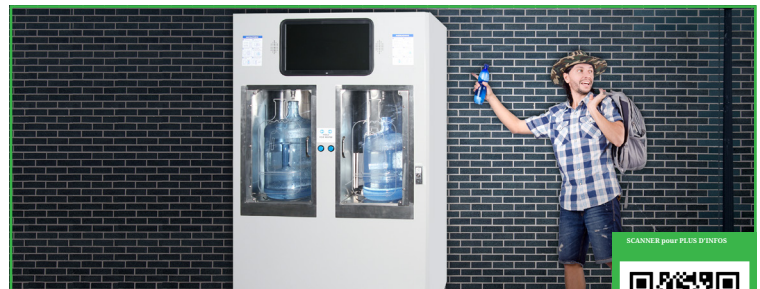
Eau propre pratique