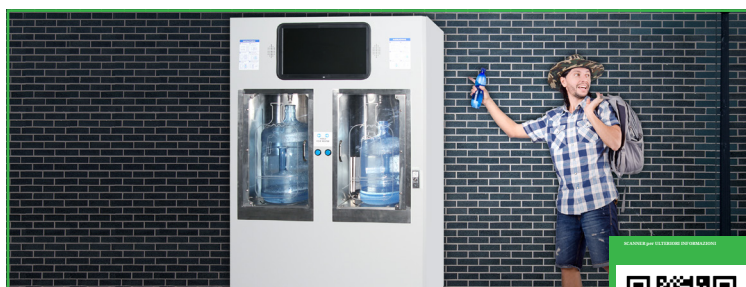
Acqua pulita pratica