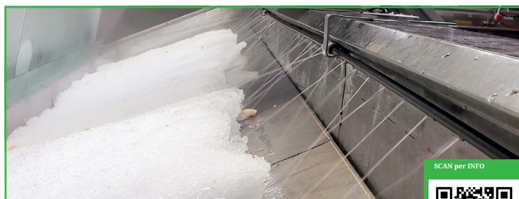
Eliminazione del Ghiaccio Con Facilità