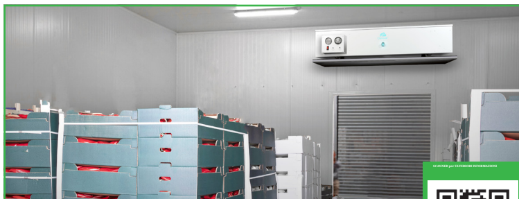
Epuratore di etilene

• SALONE DI STOCCAGGIO • MAGAZZINI • SPAZI PUBBLICI • SERRE • AGRICOLTURA & TRATTAMENTO